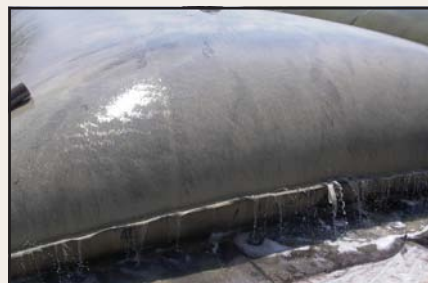
Tecnología de filtración Geotube® usada para aplicaciones de agricultura califica para fondos del EQIP.

Se puede instalar un sistema en línea de filtración Geotube® para prevenir la entrada de sólidos a la laguna. Ud. almacena agua para riego, no desperdicios con los que tiene que lidiar posteriormente. El sistema no interrumpe otras operaciones.