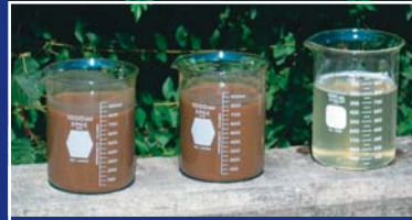
Lodo antes (izquierda) y después (derecha) del tratamiento con tecnología de filtración Geotube®.

Y una de las más efectivas. La reducción del volumen puede ser de hasta de un 90%, con un alto contenido de sólidos, lo que hacen la disposición y remoción fácil.