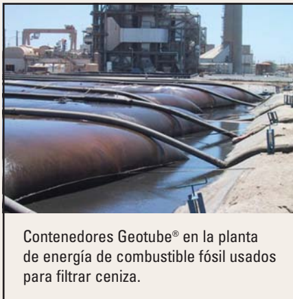
Contenedores Geotube® en la planta de energía de combustible fósil usados para filtrar ceniza.

La tecnología de filtración Geotube® confina confiablemente la ceniza, previniendo que partículas contaminantes vuelen por efecto del viento en los patios de cenizas. La ceniza puede ser entonces usada para aplicaciones como base de carpeta asfáltica, o hasta para construir los terraplenes alrededor de las lagunas para incrementar su capacidad. En muchas de las aplicaciones de ceniza, no hay necesidad de añadir polímero al proceso de filtración, haciéndolo sencillo y accesible.