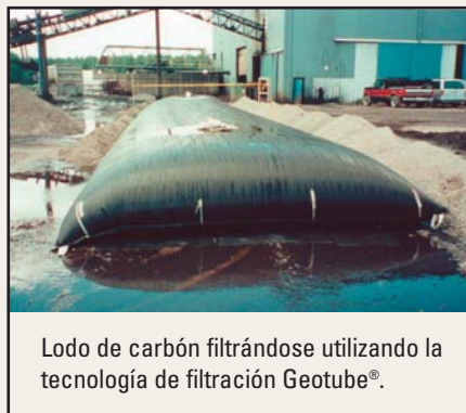
Lodo de carbón filtrándose utilizando la tecnología de filtración Geotube®.

Desechos de minería, lodos de carbón, y otros materiales pueden ser controlados y manejados eficazmente con tecnología de filtración Geotube®. Debido a que los contenedores Geotube® pueden ser fabricados a la medida de la aplicación, pueden ser colocados en los espacios disponibles entre las estructuras existentes, y removidos una vez que la filtración se termine. La tecnología de filtración Geotube® es una alternativa eficaz en costo al proceso mecánico. Reduce el costo de disposición al producir altos contenidos de sólidos con muy poco mantenimiento.