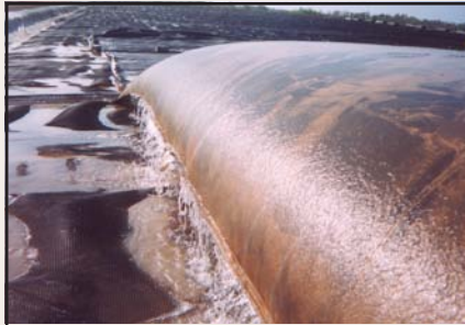
Agua desaguando de un contenedor Geotube®.

En algunos casos, compañías han filtrado los materiales de sus lagunas utilizando tecnología de filtración Geotube®, y posteriormente usado los contenedores Geotube® rellenos de sólidos como terraplenes para aumentar la capacidad de sus lagunas. La eficiencia del filtrado puede ser mejorada debido a que los contenedores Geotube® protegen a los sólidos filtrados de volverse a humedecer con el clima húmedo. Y los contenedores Geotube® pueden ser apilados uno sobre otro para añadir mas capacidad.