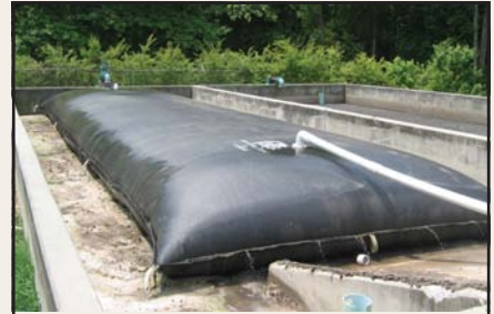
Unidades Geotube® en lechos de secado en planta municipal de tratamiento de aguas residuales.

Unidades disponibles a medida para caber en los lechos de secado. También tenemos una unidad diseñada convenientemente para caber en una caja tipo "roll-off".