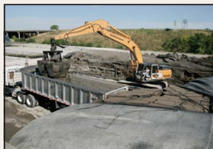
Lodo filtrado siendo removido de un contenedor Geotube® con una pala mecánica.

Los sedimentos marinos pueden ser contenidos y filtrados fácilmente con la tecnología de filtración Geotube®. Esto puede ser logrado en, o muy cerca del sitio, utilizando una celda de filtrado donde los contenedores Geotube® pueden ser apilados a varias alturas para maximizar el espacio. Las unidades Geotube® pueden ser adecuadas para aplicaciones de gran o pequeña escala, y contener efectivamente hasta materiales peligrosos, reduciendo su volumen dramáticamente, ahorrando miles en costos de disposición.