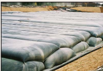
Contenedores Geotube® en la laguna de lodos activados en la planta de papel.

La rapidez con la que una operación de filtrado Geotube® puede ser puesta en marcha, ha sido una ventaja en las fábricas de papel, particularmente en situaciones de emergencia cuando las fábricas estuvieron en riesgo de parar las operaciones.