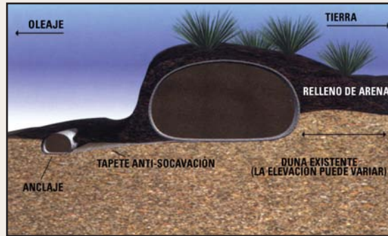
Sección transversal de una duna de arena con Geotube®.

En muchas áreas costeras, permisos temporales ya han sido autorizados para la inmediata instalación de tecnología de geoconfinamiento Geotube® para la protección de casas que están en peligro.