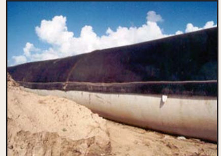
Cubiertas protectoras cubren los contenedores Geotube® de los dañinos rayos UV del sol.

Mejor aún, aves y otra especies salvaje, encuentran la unidades expuestas Geotube®, como un lugar ideal para descansar, asolearse y pescar.