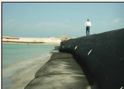
Contenedores Geotube® apilados para producir esta estructura protectora.

Los contenedores Geotube® pueden ser apilados en capas para producir la elevación necesaria para el relleno y creación de tierra firme. Los contenedores pueden ser cubiertos con piedra, arena u otro tipo de suelo para ocultarlos, y producir líneas de costa de apariencia natural.