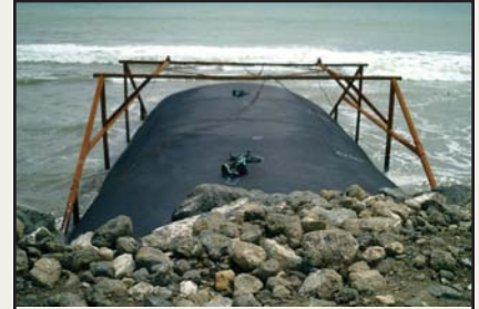
Unidades Geotube® mantenidas en su sitio por un bastidor de acero mientras son llenadas.

La tecnología Geotube® permite una gran versatilidad en la construcción. Porque las unidades son fabricadas a la medida en varios largos y circunferencias, se consigue usar menos material. También porque las unidades Geotube® pueden ser llenadas rápidamente en el lugar, el tiempo de construcción se reduce drásticamente.