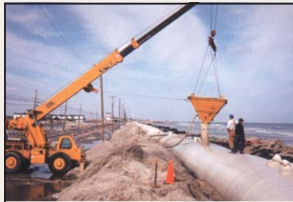
Unidad Geotube® siendo llenada con arena usando una tolva.

De hecho, una de las ventajas de la tecnología de geoconfinamiento Geotube® es que la suave pendiente original de la playa puede ser recreada. Esto mejora la estética de la línea de costa, y también ayuda a la vida salvaje, creando un hábitat de apariencia natural, y bloquea la luces de la costa, que pueden confundir a las tortugas marinas y otras criaturas.