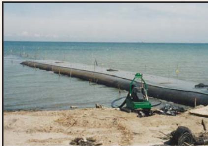
Contenedores Geotube® siendo colocados para crear espigones en la obra de toma de una granja camaronera.

Debido a que las unidades Geotube® pueden ser fabricadas a medida, la aplicación de espigones puede ser diseñada para máximo desempeño. Las unidades de Geotube® pueden ser rellenas con arena local cuando es posible, simplificando el proceso de construcción. Si las regulaciones requieren que el relleno sea de otro lugar, las unidades aun pueden ser llenadas a menor costo que otros métodos de construcción.