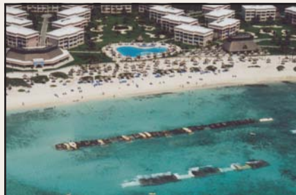
Unidades Geotube® colocadas en el mar como rompeolas.

Los contenedores Geotube® pueden ser colocados lejos de la playa donde la acción de la olas está causando daño. Las unidades interrumpen el paso del agua y de las olas, y el tamaño y la localización de las estructuras puede ser calculado por los ingenieros favoreciendo la recuperación de la playa, por las olas modificadas que ahora llegan a la playa. Muchas comunidades han ganado metros de costa con una simple, y barata instalación de Geotubes® en el mar.